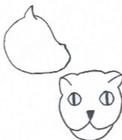
Mâchoires inférieures avancées

Faites l'expérience sur vous devant une glace (de préférence seul(e) si vous voulez garder bonne contenance) : essayez de prendre un air doux avec votre mâchoire en place normale, puis mettez-vous dents sur dents et enfin en prognathisme vrai. D'après vous, à quel moment avez-vous l'air le plus avenant ? (pour ceux qui répondent : à aucun moment, je ne peux rien faire ...)