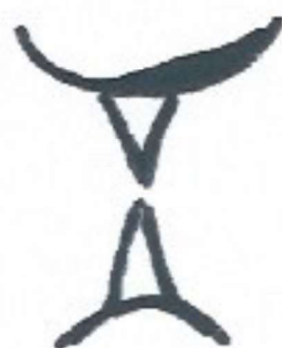
Dent sur dent